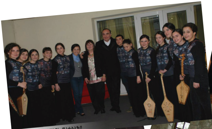
ქართული პარტიის ღირსი წევრები