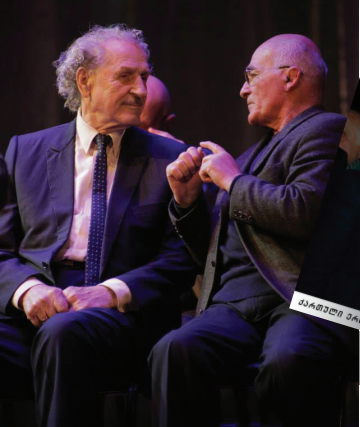
ქართული პარტიის ღირსი წევრები